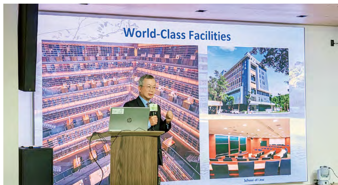
校長李蔡彥親赴美西延攬人才，深度解析校務發展願景，傳遞政大對頂尖學者歸國任教的誠摯邀請