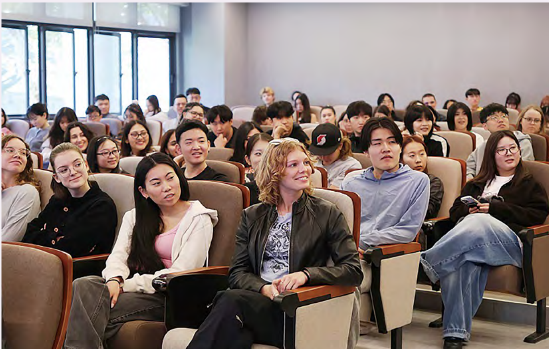
Exchange students attentively listen to the speaker's introduction to essential campus life information.

Article by the Office of International Cooperation