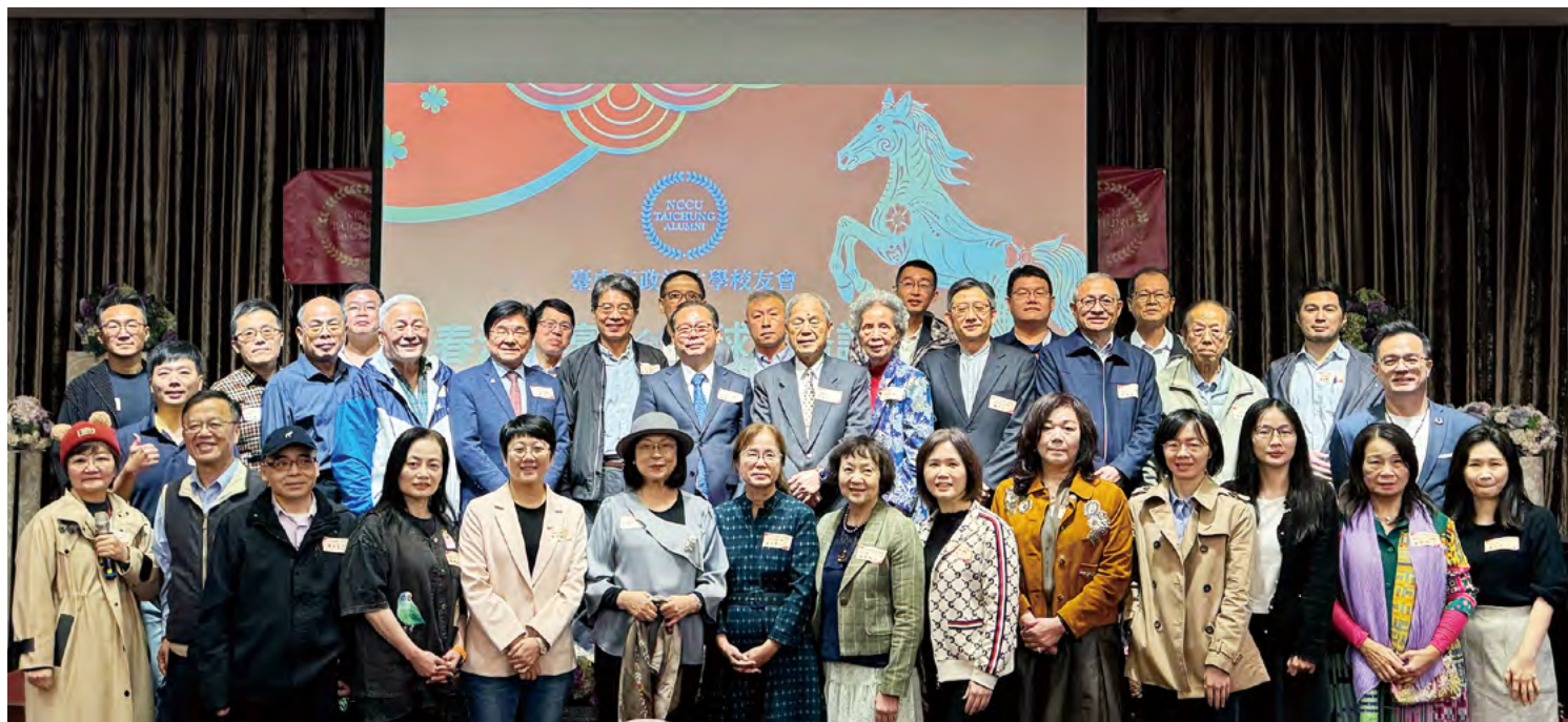
臺中校友會春酒暨大會師