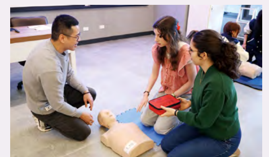
Firefighters from the Taipei City Fire Department instructed students on how to use an AED and conducted CPR emergency response drills.

The event was held in the College of Law building, which was officially inaugurated in June of last year. After the session, students enjoyed refreshments in the spacious and comfortable common areas, interacting with one another as they embarked on their academic journey and exploration at NCCU.