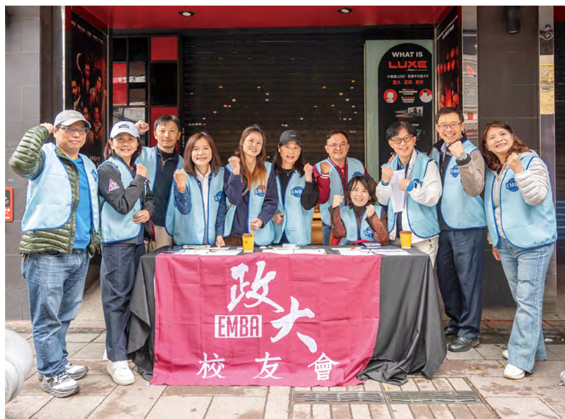
EMBA 校友會向來熱心公益，一馬當先