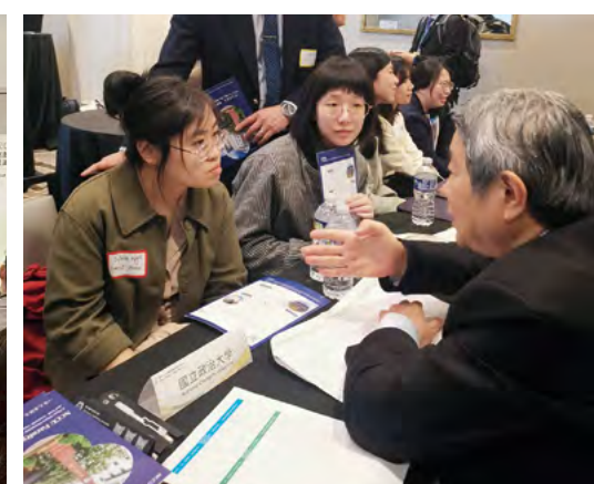
右圖：政大攤位在美國攬才活動中人氣高漲，活動期間人潮不斷，座位供不應求