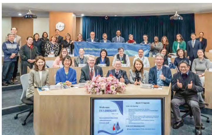
政大長年重視與 Fulbright 合作，自 2015 年推動聯合獎學金計畫以來，持續拓展校園國際視野