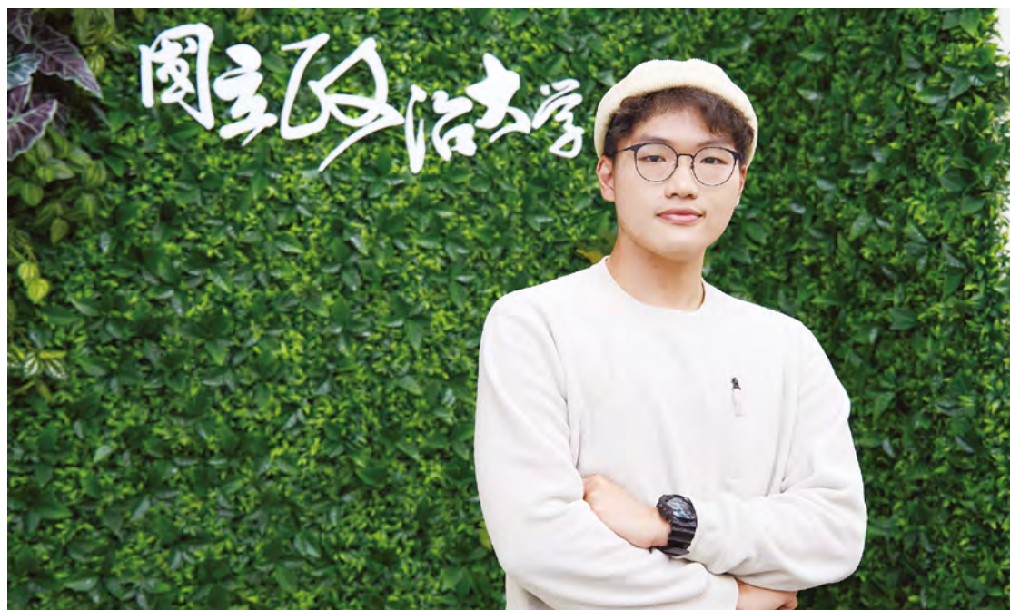
嘉騏在成長過程中早早扛起照顧弟妹的重擔