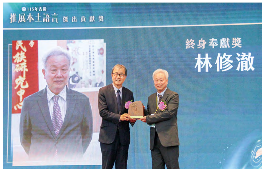
林修澈教授獲頒教育部「推展本土語言終身奉獻獎」

林修澈教授多年來在學術研究、政策倡議與教育實務上的持續投入，不僅為臺灣原住民族語言保存與發展奠定深厚基礎，也為國家語言多樣性與文化永續做出卓越貢獻。