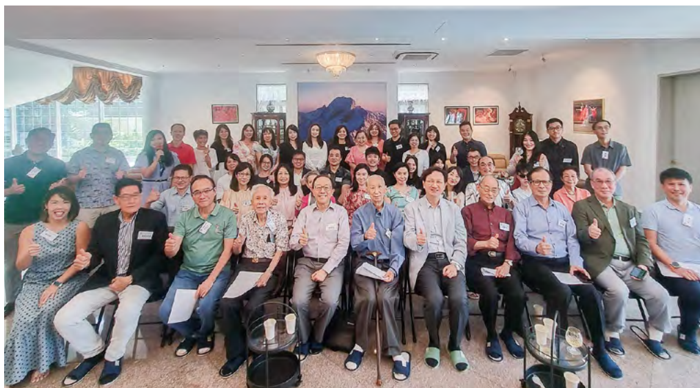
新加坡校友會聲勢逐年壯大