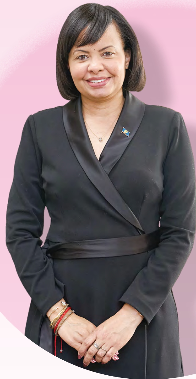
貝里斯駐臺大使梅凱瑟曾就讀政大國企，二十年後以深厚商管背景重返臺灣，成為促進兩國友誼的重要橋樑（攝影：秘書處）

訪談最後，梅凱瑟大使以校友身分對政大學弟妹寄予厚望。她鼓勵年輕學子要勇於嘗試、大膽夢想，不要被傳統框架限制了自己的發展。她特別勉勵女性學子要具備突破天花板的勇氣，無論是在外交、商管或任何專業領域，「不要害怕打破障礙（break barriers）」大使目光堅定地說。