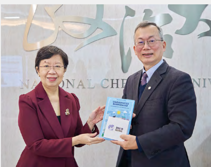
Since establishing a university-level partnership in 2014, NCCU and SMU have achieved significant results in student exchange, dual-degree programs, and collaborative projects between their colleges of business and law.

Looking ahead, the two institutions plan to deepen collaboration in student mobility, joint research projects, and faculty exchange, while also exploring the development of new types of master's programs tailored to senior executives and evolving societal needs. This high-level dialogue not only strengthens the sister-university partnership between NCCU and SMU but also offers forward-looking strategic insights into how higher education in Asia can respond to a rapidly changing world.