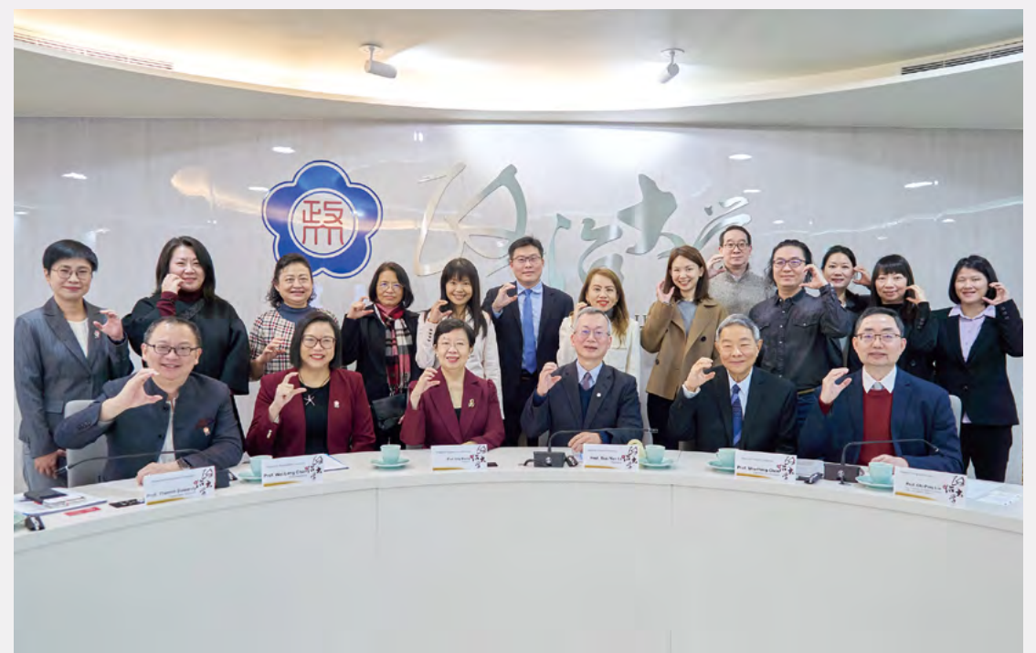
NCCU and SMU will further deepen collaboration in student mobility, joint research projects, and faculty exchange in the future.

Lee highlighted that both universities will celebrate important milestones next year—SMU's 25th anniversary and NCCU's 100th anniversary. These milestones not only symbolize the strong academic foundations of both institutions but also reflect their long-standing commitment and shared mission in advancing education in the humanities and social sciences. President Kong also introduced the concept of "purpose-driven partnerships," emphasizing that university collaborations should not merely aim to improve rankings or