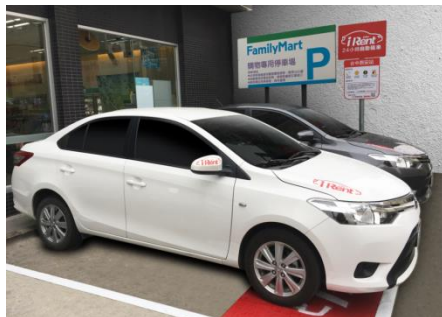
全家/萊爾富便利商店