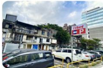
調度停車場圖 (路邊租還)