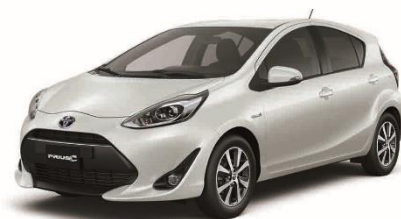
PRIUS c (HYBRID)