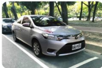
路邊公有停車格 (路邊租還)