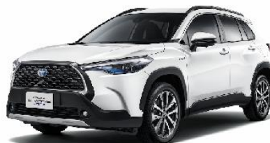
COROLLA CROSS 5人座